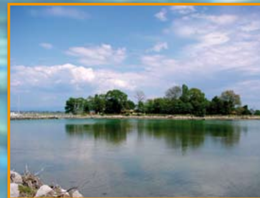
Isola di Grado